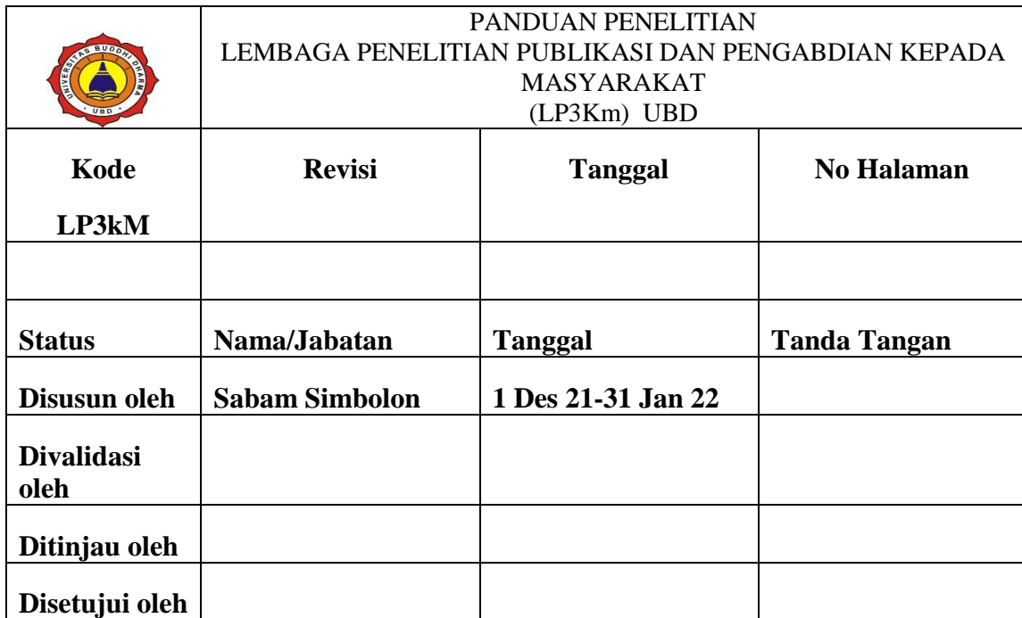
Tabel 1. Tabel Lembar Pengesahan